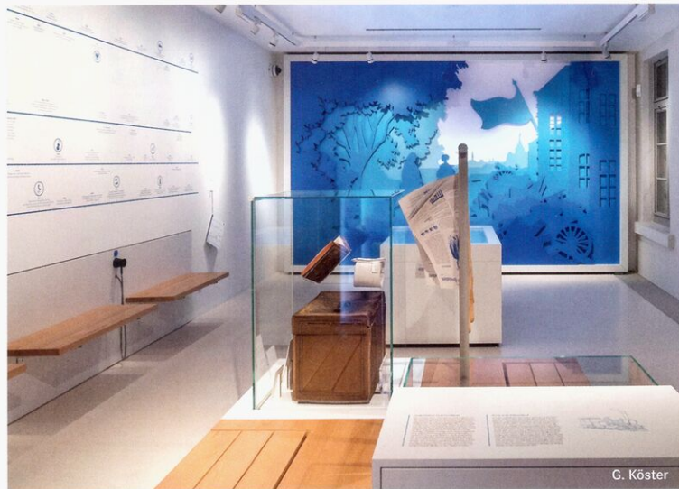
Die Ausstellung beginnt mit dem Blick auf „Zeit, Stadt und Gesellschaft“, eine scherenschnittartige Installation thematisiert dabei Romantik und Revolution.

An den Türen des Schumann-Hauses konnten bis zu siebzehn übereinanderliegende Farbschichten freigelegt werden, darunter Farbtöne aus der Schumann-Zeit.