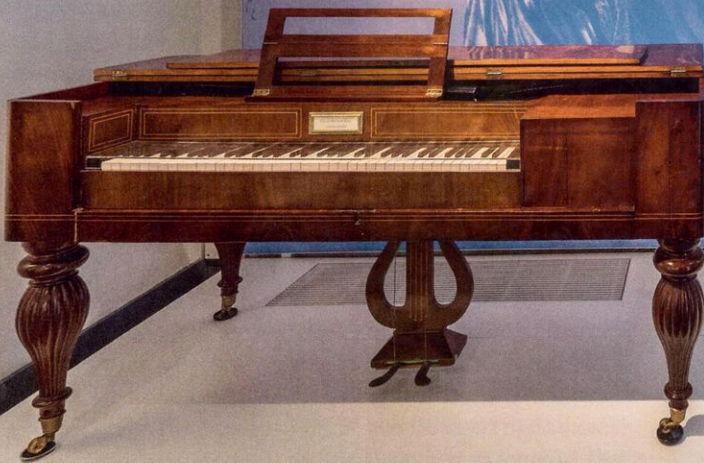
Clara Schumann war begeistert von Klavieren der Düsseldorfer Firma Klemm. Ihr Mann schenkte ihr 1853 einen Klemm-Flügel. Im Bild ein Klemm-Tafelklavier.

Als das berühmte Komponistenehepaar Clara und Robert Schumann im September 1850 nach Düsseldorf zog, da war man dort bereit, rauschende Klänge aus meisterlicher Hand zu bejubeln. Tatsächlich gab es bald Anlass zu solchem Jubel, vor allem bei der Uraufführung von Schumanns Rheinischer Symphonie nur fünf Monate später. Doch fast ebenso schnell kam es zu ersten Misstönen im Verhältnis zu den beiden Musikgrößen – Misstöne, die schon während der zwei Jahre unüberhörbar wurden, in denen das Paar noch nach einer dauerhaften Bleibe für sich und seine Kinder suchte. Das Haus in der Bilker Straße, das die Familie 1852 nach vier Umzügen schließlich zu ihrem Heim machte, wurde jüngst als Museum neu eröffnet. Es erzählt von genialen Leistungen und von bissigen Lästereien.