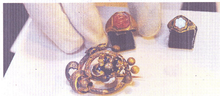
Roberts Siegelring und Claras Brosche

Kulturdezernent Hans-Georg Lohe: „Ich bin der Auffassung, dass das Haus komplett für eine Schumann-Ausstellung genutzt werden soll.“