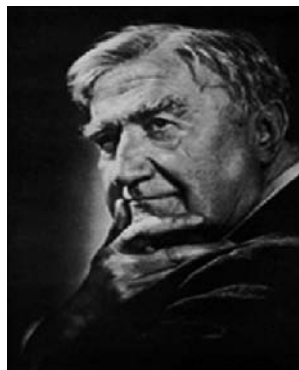
Ralph Vaughan Williams

Ganz anders in Komposition und Anlage, wenngleich auch in der inhaltlichen Botschaft mit dem Oratorium „Die Weltalter“ von Distler vergleichbar ist die zweite Komposition, die hier vorge-