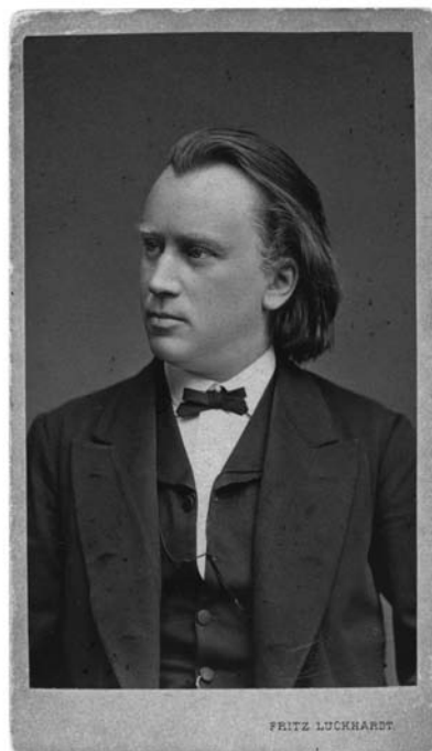
Johannes Brahms, Wien, 1874