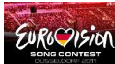
Eurovision Song Contest

Sie hatten in diesem Rahmen noch nie gemeinsam geprobt, aber am Freitag, 6. Mai, feierten sie als größter Kinderchor Deutschlands Premiere: Anlässlich des Eurovision Song Contest (ESC), der in der kommenden Woche in der Arena in Düsseldorf stattfindet, wurde eine der SingPausen der städtischen Grundschulen in der "airberlin world" im Arena-Sportpark ausgetragen. Am großen Gemeinschafts-Konzert, das vom Städtischen Musikverein zu Düsseldorf organisiert wurde, nahmen rund 3.500 Kinder der Klassen drei und vier aus insgesamt 34 Schulen teil. 26 Singleiter koordinierten den großen Auftritt. Geboten wurde ein bunter Strauß an bekannten Melodien, der von Volksliedern über Schlager aus den 50er-Jahren und der Europa-Hymne bis hin zu Klassikern reichte. "Die SingPause ist einer der Höhepunkte im städtischen Rahmenprogramm zum ESC", sagte Oberbürgermeister Dirk Elbers, der die Eröffnung des außergewöhnlichen Konzertes vornahm.