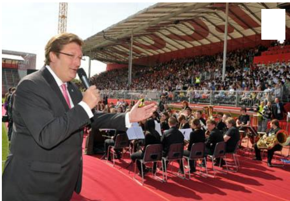
OB Dirk Elbers begrüßte Deutschlands größten Kinderchor. (3 Bilder).

Zum ersten Mal seit dem Beginn der Singpause im Jahr 2006 wurden die singenden Kinder instrumental begleitet. Aus verschiedenen Blasorchestern der Clara-Schumann-Musikschule wurde für diese ESC-Veranstaltung ein Ensemble von 170 Musikern im Alter zwischen sieben und 20 Jahre gebildet, das nicht nur den SingPause-Chor begleitete, sondern auch ein eigenes Programm präsentierte. Der SingPause-Chor füllte mit den Begleitpersonen die komplette West-Tribüne der "airberlin world", davor, auf der Rasenfläche, war das Blasorchester der Clara-Schumann-Musikschule postiert. Die Ost-Tribüne war dem Publikum vorbehalten.